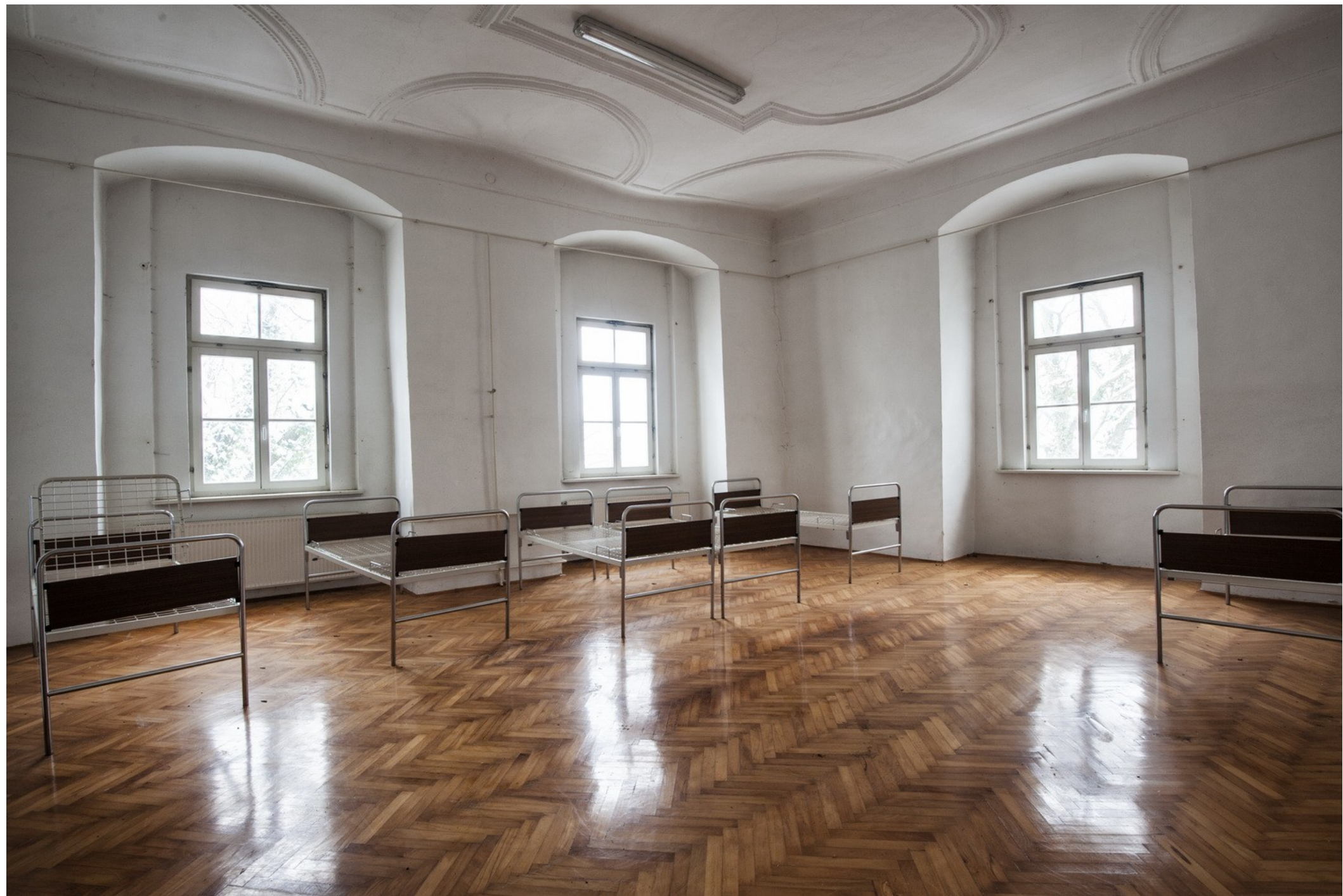
Grad Cmurek, Foto: Katja Bidovec, januar 2014