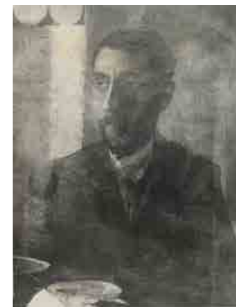
Petkovškov avtoportret, Wikipedija