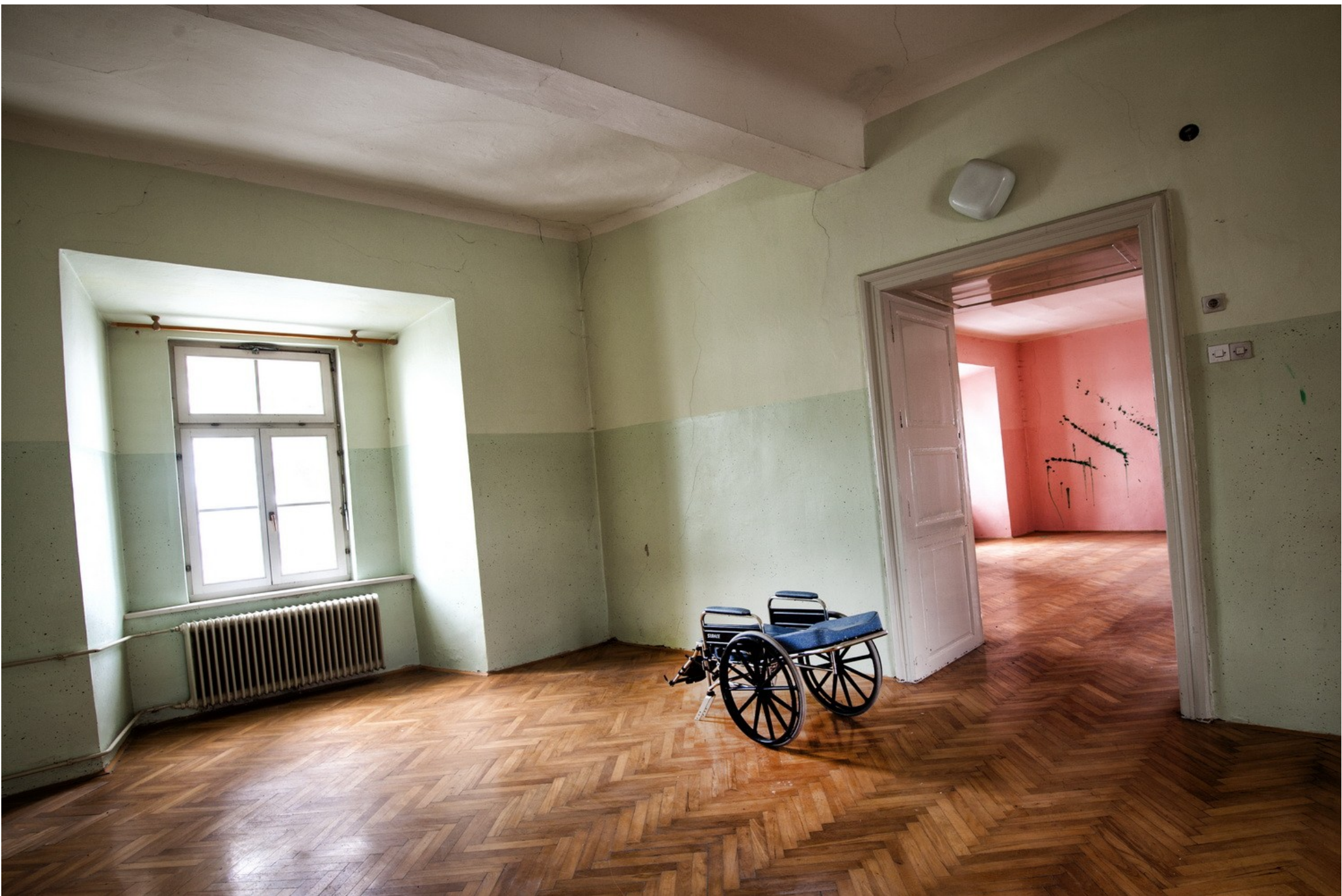
Grad Cmurek, Foto: Katja Bidovec, januar 2014