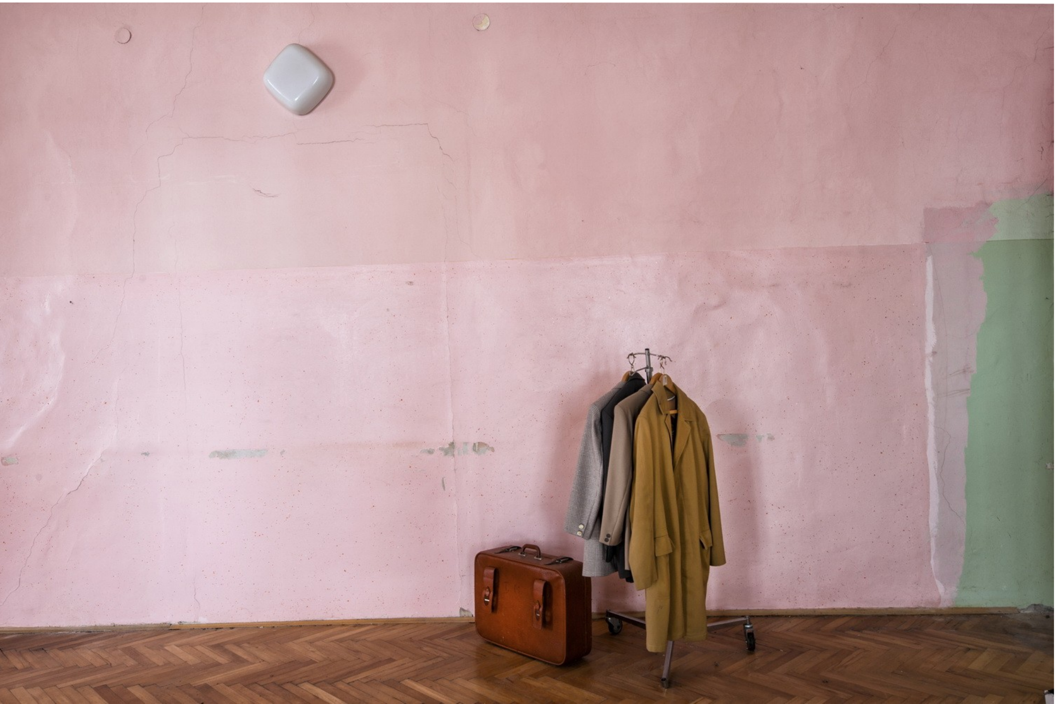
Grad Cmurek, januar 2014