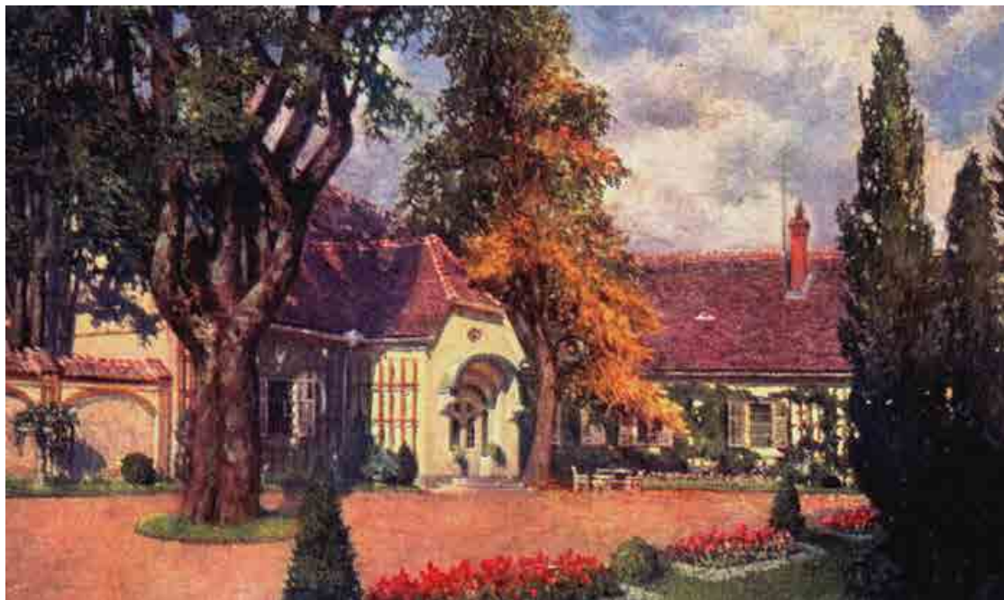
Novi Kinek s parkom