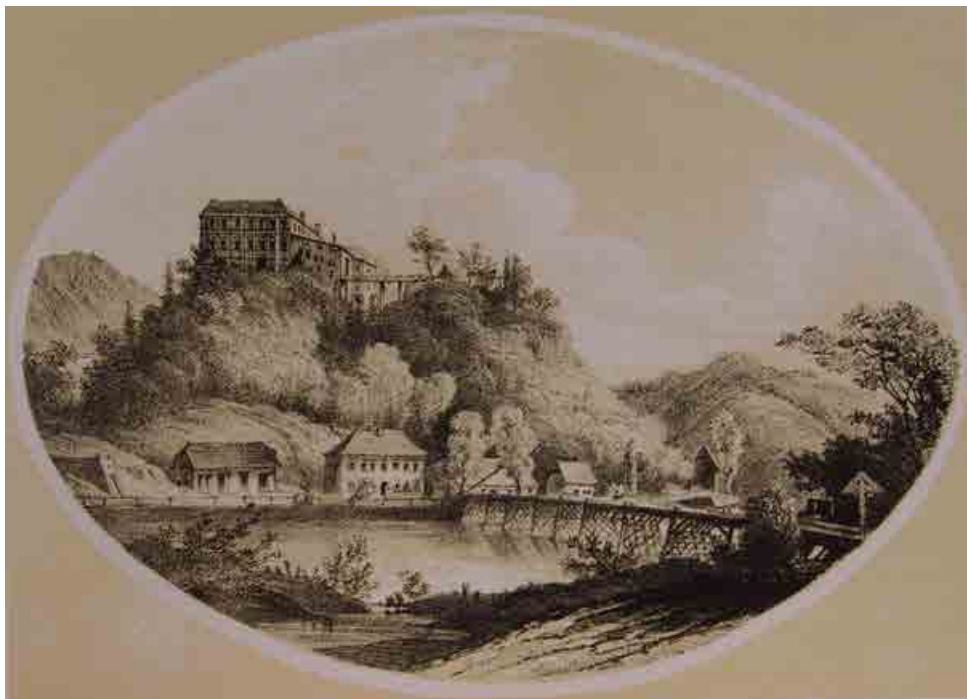
Grad Cmurek okoli leta 1864