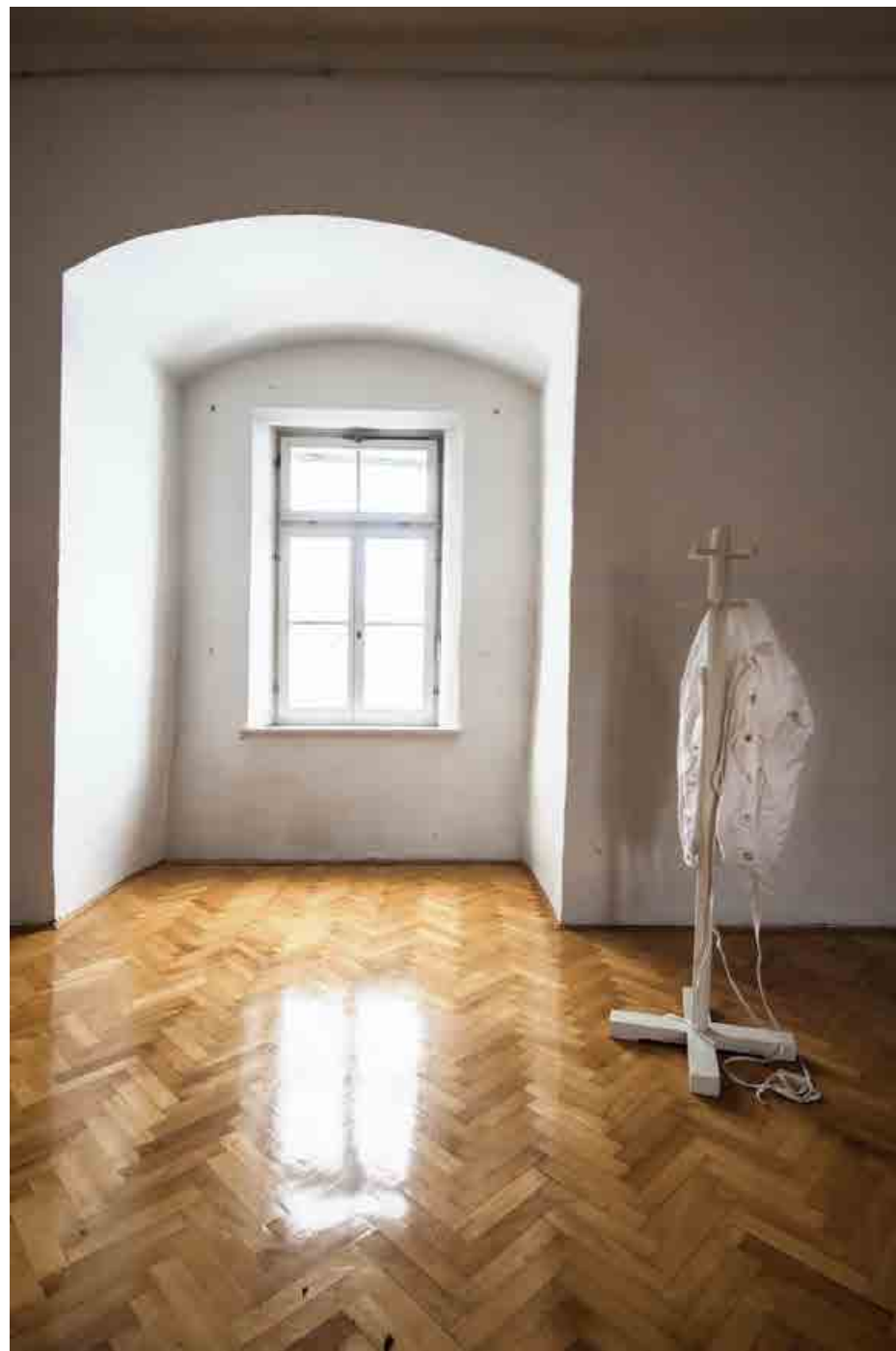
Grad Cmurek, Foto: Katja Bidovec, januar 2014