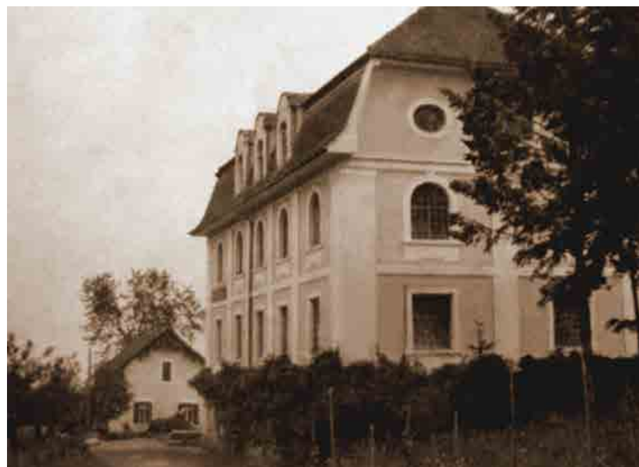
Hansonov mlin, Petkov mlin